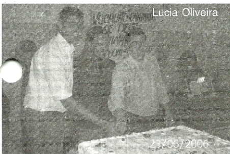
Confraternização após os ministérios

Ao serem instiuidos aos ministérios, eles passaram a ser reconhecidos pela Igreja como ministros oficiais que têm como função a leitura da Palavra de Deus nas assembléias litúrgicas, a exceção do evangelho; bem como apresentar as intenções da oração dos fiéis e, na ausência do padre ou diácono, fazer a explicação das