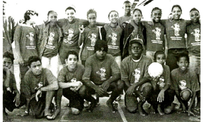
Crianças e adolescentes atendidos pelo Educandário

O Educandário Sagrados Corações funciona de segunda à sexta-feira das 8h às 16h e atende crianças e ado-