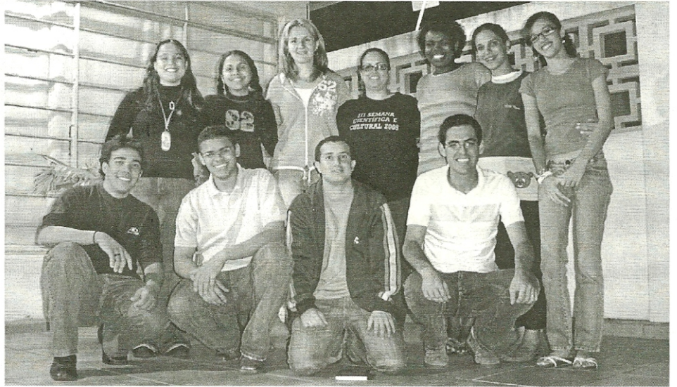
Jovens que compõem a equipe da PASCOM que atuará no “Programa Interação”

Na edição anterior, anunciávamos a edição de um programa radiofônico elaborado por jovens das nossas comunidades. O processo de elaboração continua e já é possível