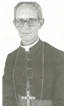
3º Bispo: Dom Pedro Fré – Lema: “Curar os corações feridos”.